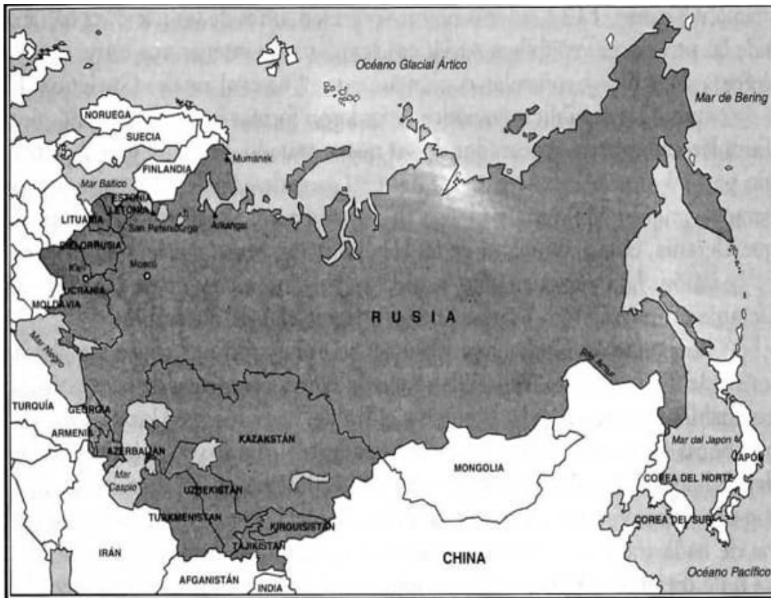
Estados sucesores de la Unión Soviética, 1992

El presidente Bush, sin embargo, demostró audacia al poner fin a la carrera de armamentos nucleares. El 27 de septiembre de 1991 anunció que Estados Unidos retiraría o destruiría todas las armas nucleares tácticas que tenía desplegadas en Europa y Asia y en barcos de guerra. También dijo que Estados Unidos abandonaría los planes de desplegar misiles móviles MX y Midgetman. Además, anunció que iba a ordenar el fin del estado de alarma de veinticuatro horas de los bombarderos estratégicos y de los misiles, unos 600 ICBM y SLBM, que debían desactivarse de acuerdo con el Tratado START. Pidió a la Unión Soviética que negociara medidas complementarias para el control de armamentos, entre ellas un acuerdo que eliminase todos los ICBM con base en tierra y múltiples cabezas nucleares (MIRV).