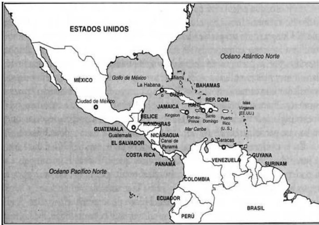
América Central, 1962

otro modo, los requisitos para mantener la hegemonía económica y política de Estados Unidos en la región tuvieron precedencia sobre las reformas sociales, económicas y políticas que pedía la Alianza para el Progreso.